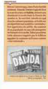
« DAVIDA », roman de Jacques Chirac