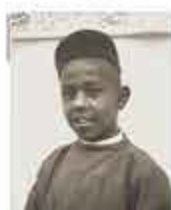
L'EXPOSITION COLONIALE DE MARSEILLE (1922) Une ville coloniale, telle qu'elle apparaît au moment de l'ouverture de l'Exposition de 1922. À l'arrière-plan, le monument de l'Algérie et, plus loin, les pavillons de l'Algérie et du Maroc, sur le parvis de l'Exposition. À l'avant-plan, le monument de l'Algérie et le pavillon de l'Algérie, sur le parvis de l'Exposition.

Les fêtes des expositions coloniales réunissent les Français sur leur territoire et les illustrent aussi à la faveur des populations coloniales. Aux côtés de Marseille en 1922, à Strasbourg en 1924, à Grenoble en 1925, à La Rochelle en 1927 ou à Paris en 1931 (Bosco) et en 1937 avec les pavillons coloniaux de l'Exposition internationale, également peuplés en France au moment du Centenaire de l'Algérie en 1936, au dix août nord-africain, des « Jours du Caïro » des fêtes, des meetings, des spectacles et autres « cabarets » sont organisés avec leurs figures. Tout un registre se construit autour de ces expositions à travers le projet, les affiches ou le relief de cartes postales – même la gravure imprimée de la France, le souvenir des indigènes et l'aménagement de l'Algérie du Nord dans l'édifice colonial. Ces événements accueillent de nombreuses personnalités venues des colonies, à l'instar du bey de Tunisie ou du sultan de Maroc, Si Mohammed ben Youssouf à Paris en 1931.