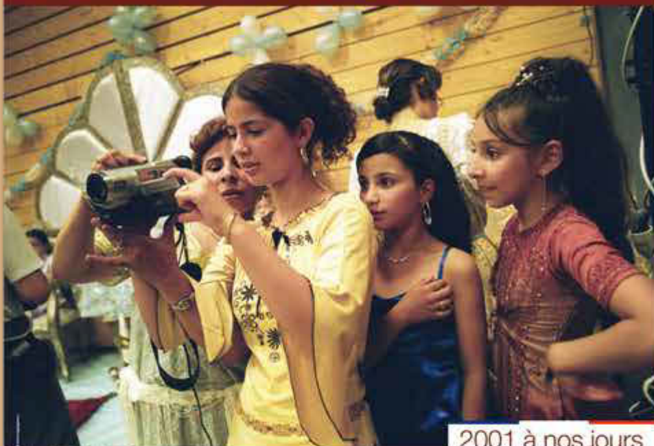
2001 à nos jours