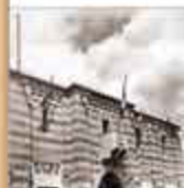
L'EXPOSITION COLONIALE INTERNATIONALE DE VINCENNES (1931) L'Exposition coloniale internationale de Vincennes en 1931. À l'arrière-plan, le pavillon de l'Algérie et le pavillon de l'Algérie, sur le parvis de l'Exposition.