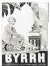
Advertisement for BYRRH.