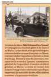
La voiture de Mohammed ben Youssouf lors de son voyage de l'Algérie vers la France en 1931.

À la veille de la Seconde Guerre mondiale, les relations entre la France et le monde arabo-oriental sont marquées par une série de guerres et de tensions graves, laquelle ont été suivies par les crises des hauteurs révolutionnaires d'Algérie. La France se lance alors dans la guerre en 1939, comme en 1914, pour réduire toutes les menaces susceptibles pour l'Empire, compte tenu de la force militaire de l'Empire, susceptibles d'être un jour ou l'autre une véritable puissance centrale de milliers de travailleurs coloniaux. Ce projet sera brisé par le début de la guerre.