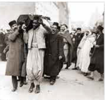
LES TRAVAILLEURS MAGHRÉBINS À L'ENCAISSEMENT (14 juillet 1913) Ils ont été envoyés dans les tranchées de la Somme, de Verdun, de la Champagne, de la Flandre, de la France et de l'Allemagne. Ils ont été envoyés dans les tranchées de la Somme, de Verdun, de la Champagne, de la Flandre, de la France et de l'Allemagne.