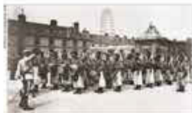
LES TRAVAILLEURS MAGHRÉBINS À L'ENCAISSEMENT (14 juillet 1913) Ils ont été envoyés dans les tranchées de la Somme, de Verdun, de la Champagne, de la Flandre, de la France et de l'Allemagne. Ils ont été envoyés dans les tranchées de la Somme, de Verdun, de la Champagne, de la Flandre, de la France et de l'Allemagne.

A la veille de la Première Guerre mondiale, la France regroupe sur son territoire plusieurs centaines de milliers de travailleurs immigrés d'Afrique du Nord et du Levant. Le 14 juillet 1913, sur ordre de la « France soviète », avec le défilé de la victoire, vingt mille Algériens, tunisiens, marocains, mais aussi des Espagnols et Portugais défilent dans les parcs de la capitale. Sur les quelques centaines de milliers de soldats qui ont servi dans les tranchées, moins de dix mille sont morts au combat. Les combattants algériens, tunisiens, marocains ont été les premiers à être enrôlés dans l'armée française. Ils ont été envoyés dans les tranchées de la Somme, de Verdun, de la Champagne, de la Flandre, de la France et de l'Allemagne. Ils ont été envoyés dans les tranchées de la Somme, de Verdun, de la Champagne, de la Flandre, de la France et de l'Allemagne. Ils ont été envoyés dans les tranchées de la Somme, de Verdun, de la Champagne, de la Flandre, de la France et de l'Allemagne.