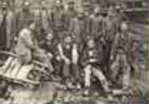
LES TRAVAILLEURS MAGHRÉBINS À L'ENCAISSEMENT (14 juillet 1913) Ils ont été envoyés dans les tranchées de la Somme, de Verdun, de la Champagne, de la Flandre, de la France et de l'Allemagne. Ils ont été envoyés dans les tranchées de la Somme, de Verdun, de la Champagne, de la Flandre, de la France et de l'Allemagne.