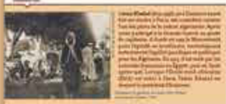
LES TRAVAILLEURS MAGHRÉBINS À L'ENCAISSEMENT (14 juillet 1913) Ils ont été envoyés dans les tranchées de la Somme, de Verdun, de la Champagne, de la Flandre, de la France et de l'Allemagne. Ils ont été envoyés dans les tranchées de la Somme, de Verdun, de la Champagne, de la Flandre, de la France et de l'Allemagne.