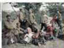
LES TRAVAILLEURS MAGHRÉBINS À L'ENCAISSEMENT (14 juillet 1913) Ils ont été envoyés dans les tranchées de la Somme, de Verdun, de la Champagne, de la Flandre, de la France et de l'Allemagne. Ils ont été envoyés dans les tranchées de la Somme, de Verdun, de la Champagne, de la Flandre, de la France et de l'Allemagne.