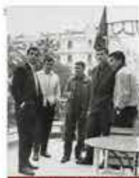
LES FOOTBALLEURS ALGÉRIENS REJOignent LE FLN (1956) Le 15 avril 1956, les joueurs algériens ont rejoint le FLN. Ils ont été les premiers sportifs à rejoindre le mouvement de libération nationale. Ils ont été les premiers à être considérés comme des citoyens algériens. Ils ont été les premiers à être considérés comme des citoyens algériens. Ils ont été les premiers à être considérés comme des citoyens algériens.