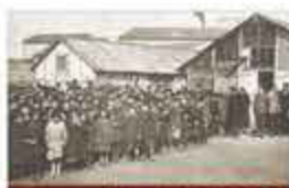
PRÉSENCE ARABO-ORIENTALE EN FRANCE (1920-1930)