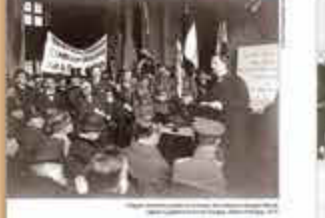
LES TRAVAILLEURS MAGHRÉBINS À L'ENCAISSEMENT (14 juillet 1913) Ils ont été envoyés dans les tranchées de la Somme, de Verdun, de la Champagne, de la Flandre, de la France et de l'Allemagne. Ils ont été envoyés dans les tranchées de la Somme, de Verdun, de la Champagne, de la Flandre, de la France et de l'Allemagne.