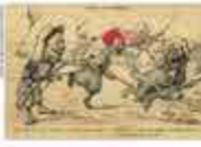
LA CAMPAGNE DE MAROC (1897-1902) La campagne de Maroc (1897-1902) est une campagne militaire menée par l'armée française en Algérie, au sein de la Garde impériale. Elle est menée par le général de Gallieni, qui est nommé gouverneur général de l'Algérie en 1897. La campagne de Maroc est menée en Algérie, au sein de la Garde impériale, et participe à la grande bataille de Sedan et à la prise de la Commune de Paris.