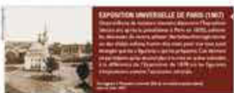
EXPOSITION UNIVERSELLE DE PARIS (1855)

Le Palais de l'Industrie, construit pour l'Exposition universelle de Paris en 1855, est le plus grand bâtiment construit à Paris pour une seule occasion. Il a été construit par le ministre de l'Industrie, Louis-Napoléon Bonaparte, et a été inauguré le 15 mai 1855. Le Palais de l'Industrie a été construit en style néo-classique et a été inauguré le 15 mai 1855. Le Palais de l'Industrie a été construit en style néo-classique et a été inauguré le 15 mai 1855.