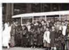
Un moment de l'Exposition coloniale de Marseille en 1922.