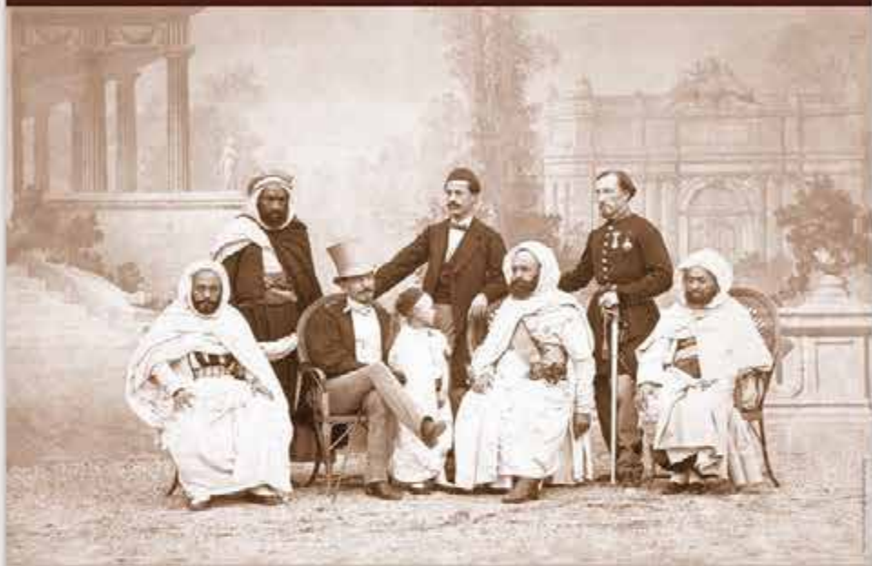
LE DOMAINE COLONIAL FRANÇAIS EN 1850