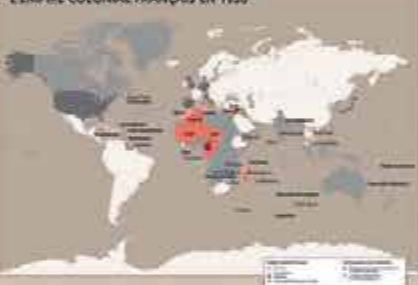
L'EMPIRE COLONIAL FRANÇAIS EN 1930