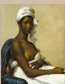
1814, Venus hottentote. Peinture de Louis-Philippe, 1814.