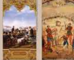
1814, L'Inde, terre fertile de commerce et de civilisation. Peinture de Louis-Philippe, 1814. © Musée de la Ville de Paris, Paris.