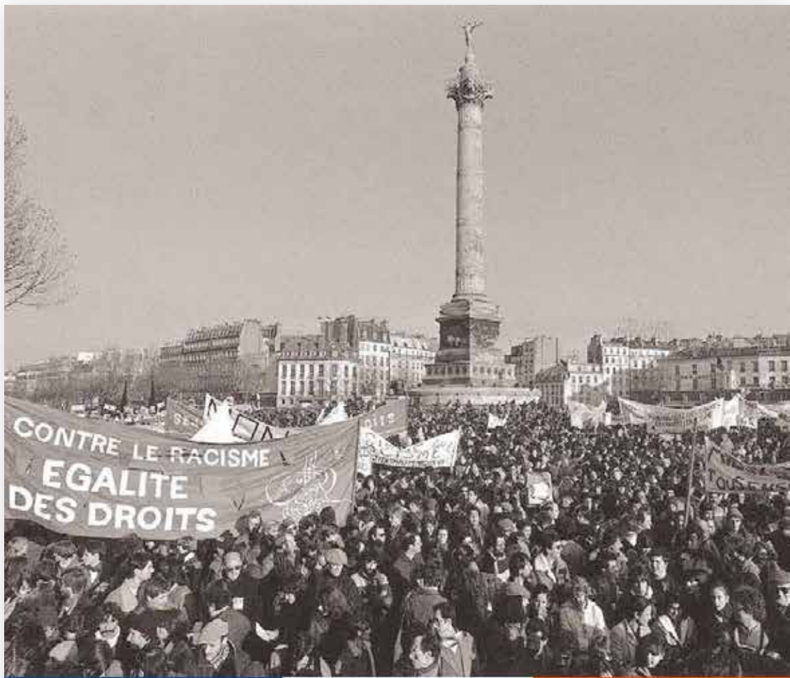
Paris, 2005.