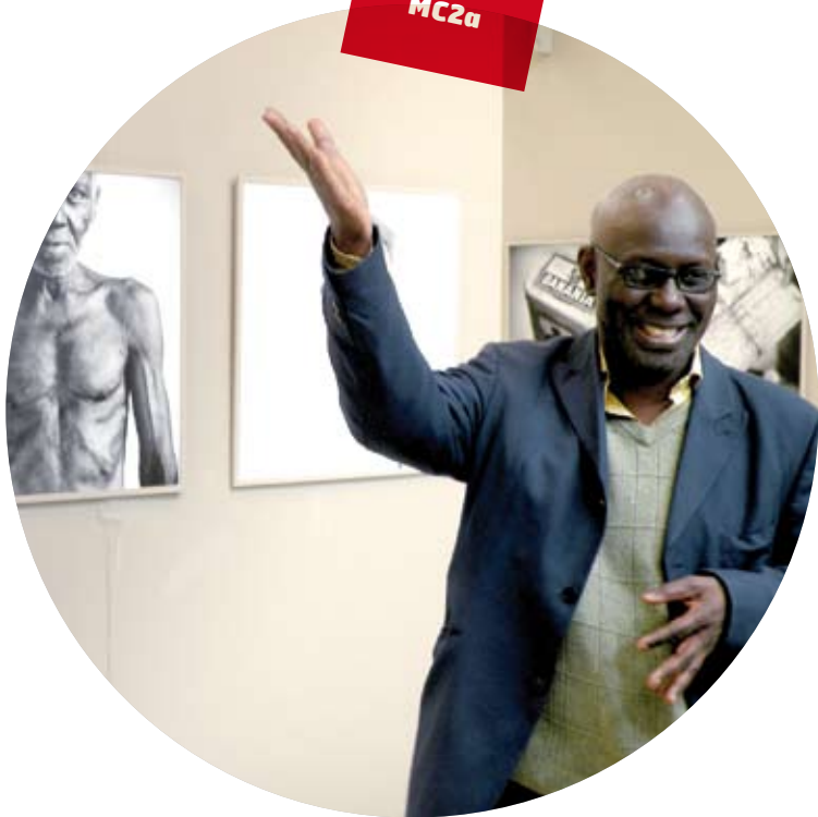
Boris Boubacar Diop