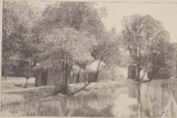
Cultures au bord de la mer

Une femme tahitienne... (text describing a Tahitian woman)