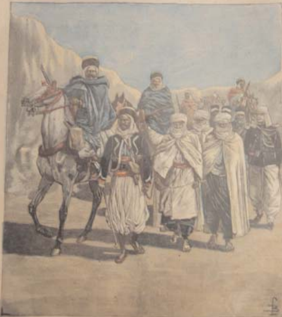
LES ASSASSINS DU MARQUIS DE MORÈS CONDUITS A GABES