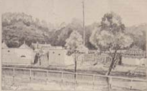
Des cases de village tahitien

Il y a une autre exposition coloniale de 1904... (text continues describing the exhibition and colonial products)