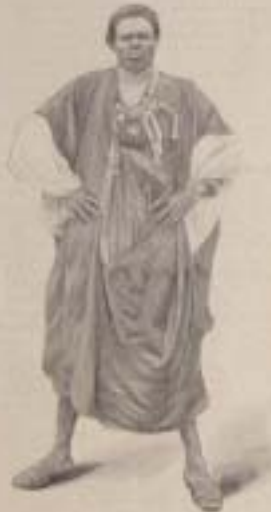
Un chef tahitien