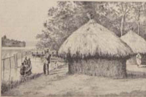
Un village tahitien

Une femme tahitienne... (text describing a Tahitian woman)